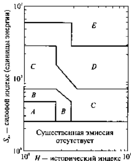
Диаграмма классификации источников АЭ в технологии МОНРАС